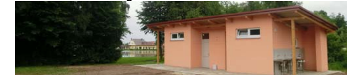
WC Anlage am Zeltplatz Weißbachmühle

Bei Abreise: Abmeldung bei Platzwart, Bezahlung der Gebühr direkt am Kiosk